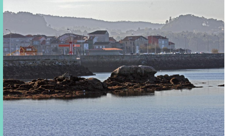
Porto de Cambados. As Mos.