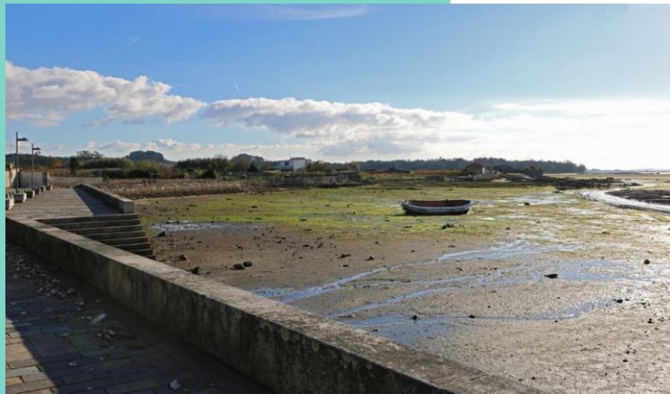
Ribeira de Mouta