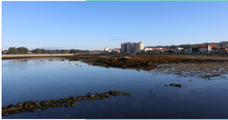
Ribeira de Fefiñáns cos cons da Empregadoira.