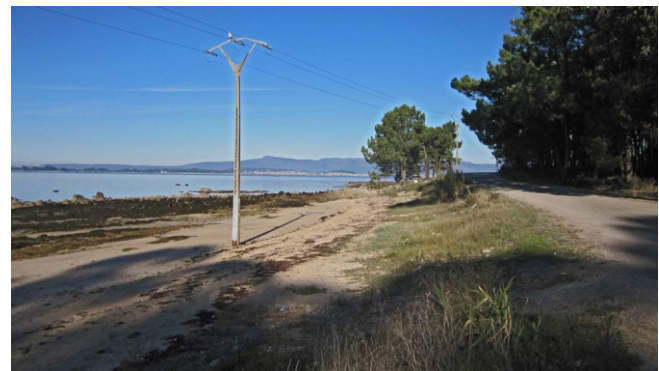
Praia de Suasrosas

O concello de Cambados atópase, na súa maior parte, no esteiro do Umia, á beira da ría de Arousa. Ten unha costa abrigada e recortada que alterna areais, rochedos, pequenas praias e esteiros; de augas calmas e de pouca profundidade e grandes áreas que quedan en seco coa marea baixa, que acollen ricos bancos marisqueiros. Está protexida, en parte no LIC/ZEC "Ons-O Grove", e nas ZEPAS "Espazo Mariño das Rías Baixas" e "Complexo intermareal Umia-O Grove..."