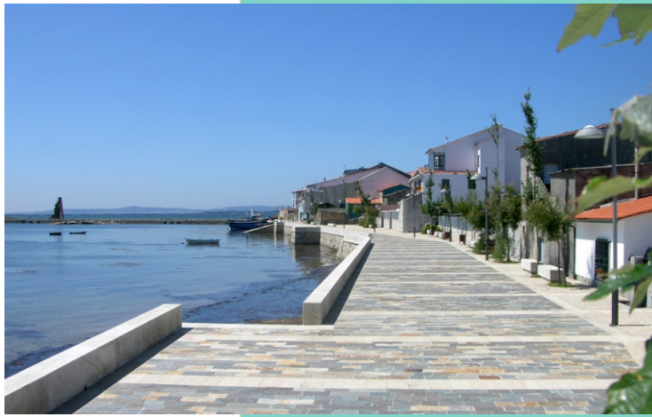
Paseo marítimo en San Tomé