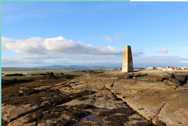
Prado do Mar. A Marca, na punta de mar de Frades