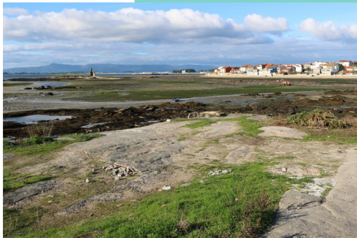
Mar de Frades