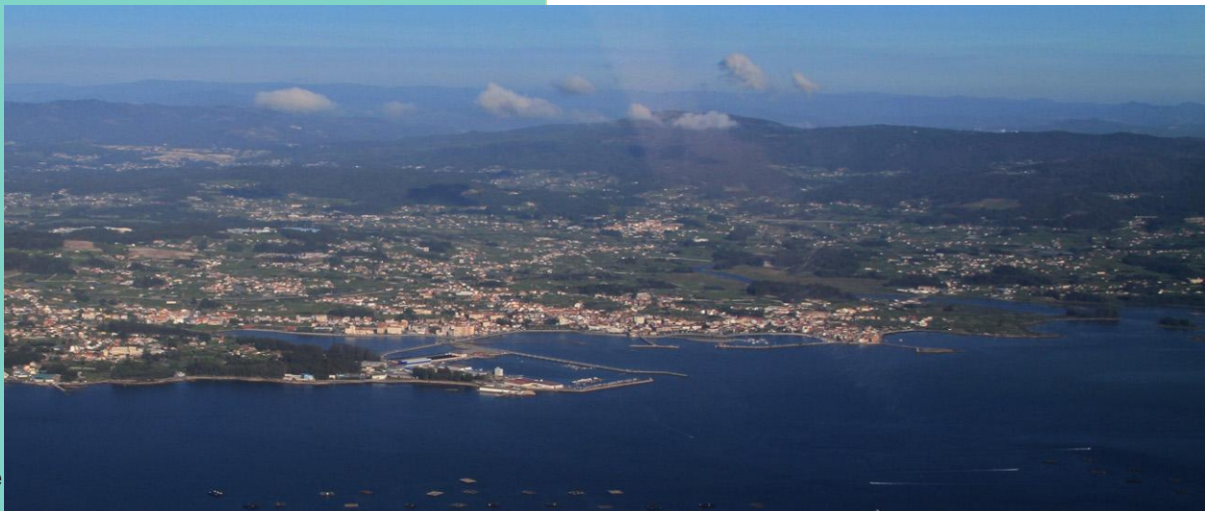
Vista aérea da costa de Tragobe e Cambados

O concello de Cambados atópase, na súa maior parte, no esteiro do Umia, á beira da ría de Arousa. Ten unha costa abrigada e recortada que alterna areais, rochedos, pequenas praias e esteiros; de augas calmas e de pouca profundidade e grandes áreas que quedan en seco coa marea baixa, que acollen ricos bancos marisqueiros. Está protexida, en parte no LIC/ZEC "Ons-O Grove", e nas ZEPAS "Espazo Mariño das Rías Baixas" e "Complexo intermareal Umia-O Grove..."