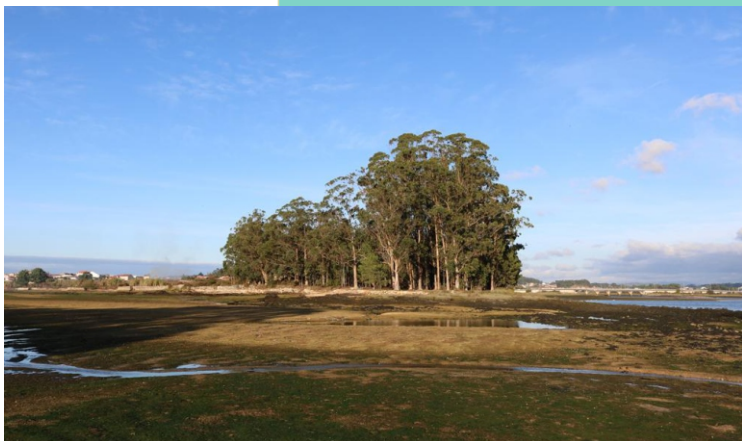
Punta de Españeiro