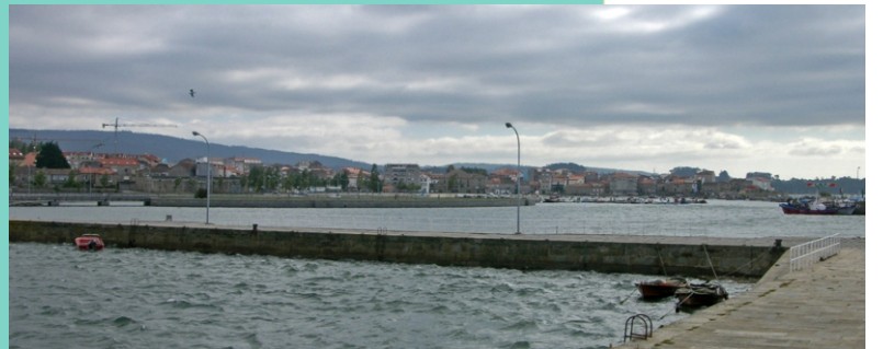
Antigo peirao de Cambados