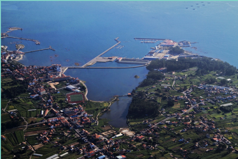
Punta de Tragobe