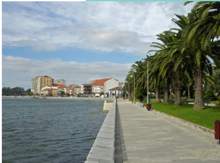
O paseo marítimo na zona dos xardíns da Calzada