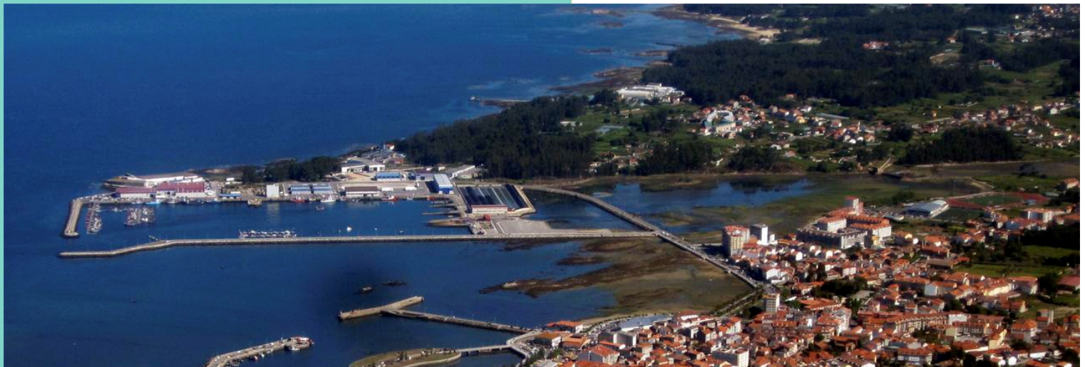
5-Porto de Tragove. A Seca. Saco de Fefiñáns