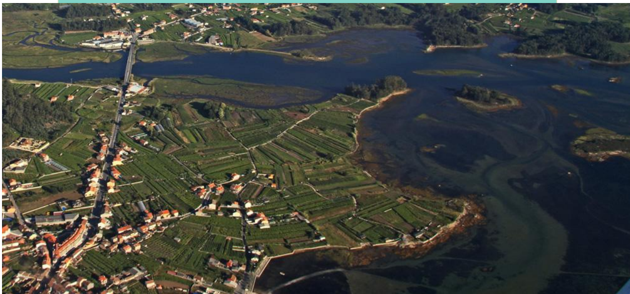
Vista aérea ds puntas de Mar de Frades e Españeiro, as Illeiras e o esteiro do Umia