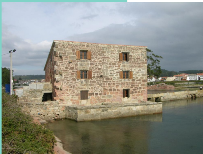
A Morosa, un pequeno illote na Seca