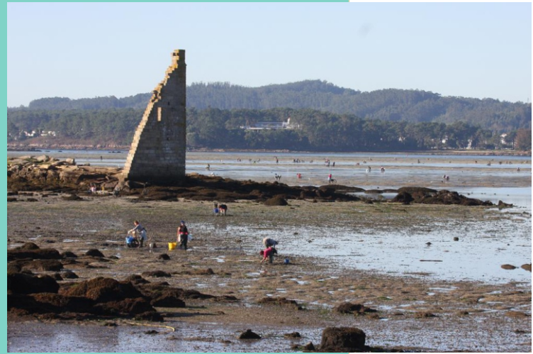
Illa de San Sadurniño e areal do Serrido.

A Torre de San Sadurniño formaba parte, xunto coas da Lanzada e Catoira, dun sistema defensivo construído no século X para defender a Ría de Arousa dos ataques normandos