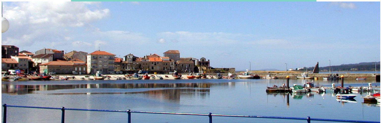
Porto de San Tomé co barrio mariñeiro.