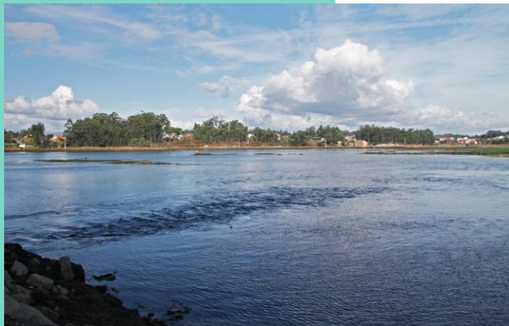
A Seca ou Saco de Fefiñáns coa marea baixa e alta