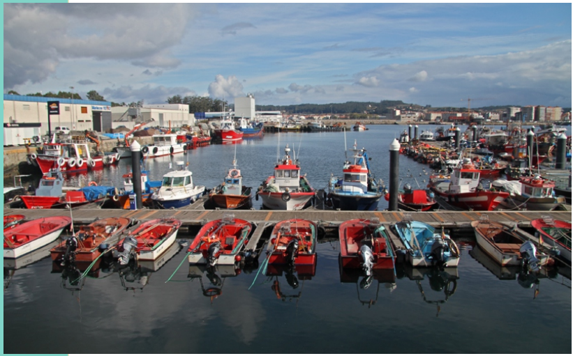
Porto de Tragobe. O porto principal e a lonxa de Cambados.

Tomamos como punto de partida Tragobe (Corvillón) a onde se accede pola estrada de Cambados a Vilagarcía, collendo o desvío no Ribeiro ata o final. Alí comeza a costa do concello de Cambados ( O Marco ), nunha área ocupada por depuradoras de mariscos. Seguindo pola beira do mar pasamos pola praia das Suasrosas e chegamos ao porto , desde onde podemos contemplar as vistas, as instalacións e as actividades (se coíncide a hora podemos visitar a lonxa ou ver o traballo das redeiras). Na saída do porto collemos unha estrada que, por entre unha naves, vai cara ao interior e, a uns 750 m, un desvío á dereita que nos leva ata a beira do estanque do muíño de marea da Seca . No caso de estar a marea baixa pódese tentar seguir pola beira da costa. Despois de ver o muíño cruzamos o dique e chegamos á zona deportiva do Pombal, desde onde arranca o paseo que percorre todo o litoral de Cambados pasando pola beira do saco de Fefiñáns , a Ribeira de Fefiñáns , A Calzada , o antigo porto de Cambados , San Tomé -onde podemos ver o porto e o núcleo mariñeiro, a illa coa Torre de San Sadurniño e o areal do Serrido ; e rematamos na Ribeira de Mouta . Aquí podemos finalizar o roteiro ou continuar por camiños ata Mar de Frades e a punta de Espiñeiro , no linde co esteiro do río Umia . O camiño de volta pódese facer polo mesmo roteiro ou polas estradas e rúas da Vila, aproveitando para visitar parte do casco histórico.