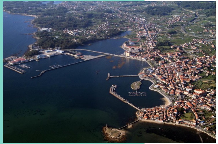
Vista aérea da costa de Tragove e Cambados